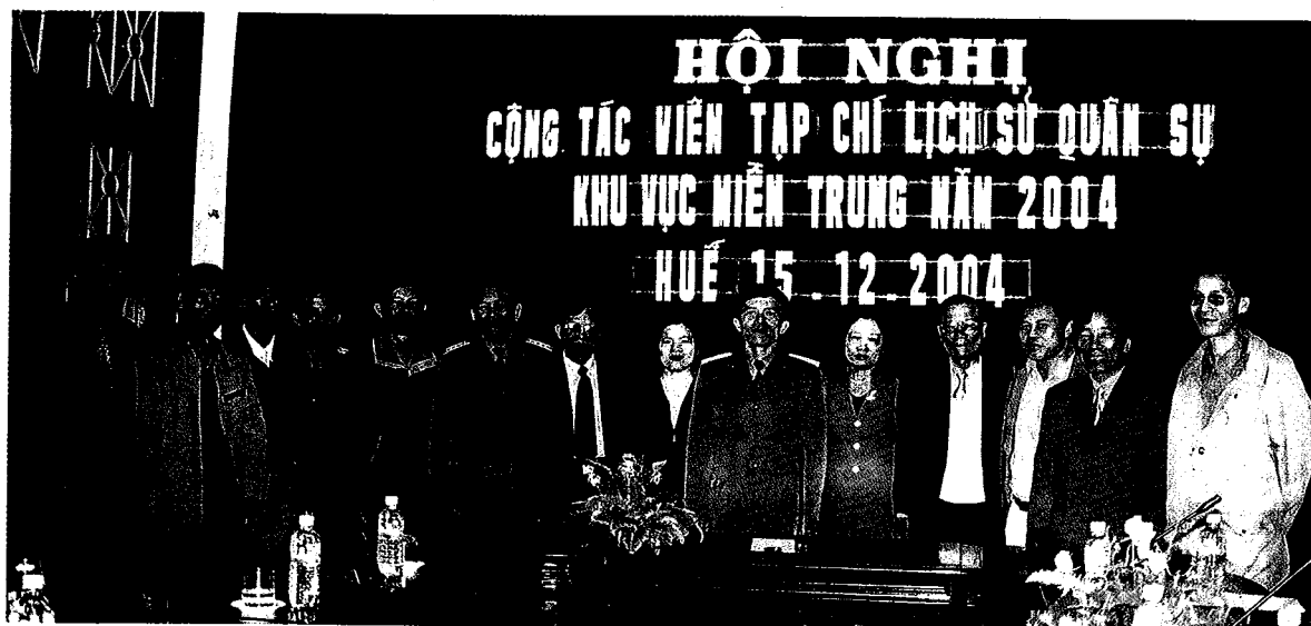
Đại biểu tham dự Hội nghị Cộng tác viên Tạp chí LSQS khu vực miền Trung, tổ chức tại thành phố Huế (tháng 12-2004). Ảnh: Hà Hải.

dụng rộng rãi tại Khoa, qua đó góp phần phổ biến, lan tỏa đến không chỉ một vài người đọc mà nhiều thế hệ sinh viên và xa hơn là đến đông đảo học sinh khắp mọi miền đất nước khi những sinh viên này ra trường, đi dạy.