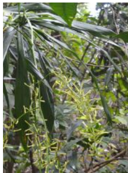
Hình 1B. Cây Sâm cau đỏ mang cụm hoa