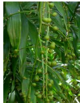
Hình 1C. Cây Sâm cau đỏ mang chùm quả