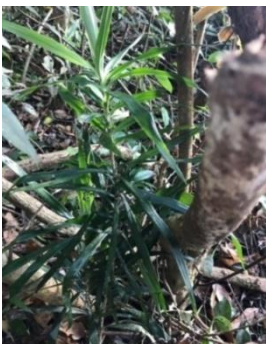
Hình 1A. Cây Sâm cau đỏ mọc tự nhiên trong rừng

Cây bụi hay cây gỗ nhỏ, cao từ 1-3 m, thân thường mọc thẳng đứng, có đường kính từ 1-3 cm, ít phân nhánh, màu nâu xám. Lá mọc so le, thường tập trung ở ngọn, phiến lá hình dải hay hình mác ngược, dài từ 15-25 cm, rộng từ 2-3 cm, có màu xanh đậm, từ từ hẹp ở đáy, bẹ lá ôm lấy thân (Hình 1.A).