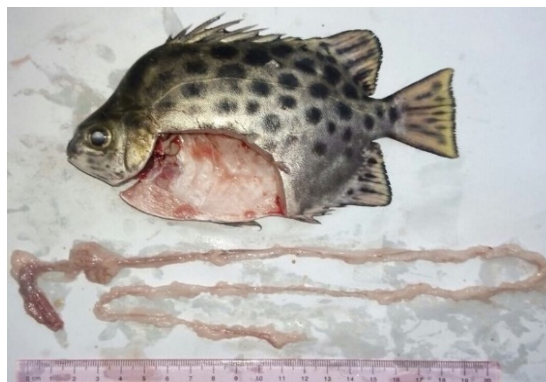
Hình 1. Hình thái cơ thể và ruột cá nâu

cm, tỷ lệ RLG trung bình là 2,91. Đối với nhóm cá có kích thước 8,5 - 14 cm và > 14 cm thì tỷ lệ RLG trung bình lần lượt là 3,18 và 3,32, đều lớn hơn 3 có nghĩa là cá nâu ở nhóm có kích thước lớn hơn 8,5 cm có tập tính ăn tạp thiên về thực vật.