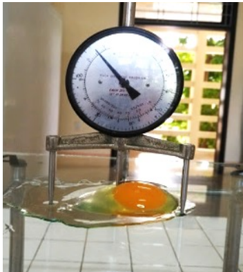
Hình 1. Dụng cụ đo độ Haugh

Xác định chỉ tiêu chất lượng lòng trắng trứng (Haugh Unit) (William & Owen, 1995): dùng dụng cụ đo độ Haugh (thước 3 chân) xác định chiều cao trung bình của lòng trắng đặc theo trọng lượng.