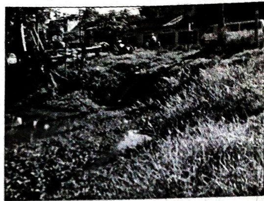
Cảnh hoang phế ở bờ hồ Tịnh Tâm